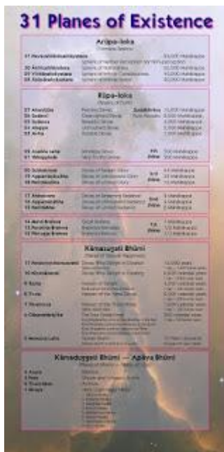
atau tabel hipotesis yang agak 'gila' dari kami ini

https://www.youtube.com/watch?v=w-QhMDG_vHY&list=PLZZa2J4-qv-bpW9lgl0XfLNL7tfMzZZD&index=64&t=12m56s